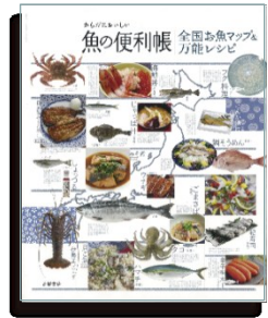
高橋書店刊 B5変形 全192ページ 定価1,365円(税込み)