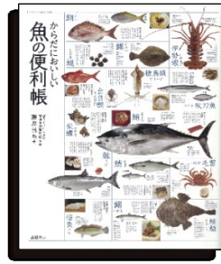
高橋書店刊 B5変形 全208ページ 定価1,470円(税込み)