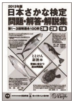
日本さかな検定協会 編 A4版 全140ページ 定価1,000円(税込み)